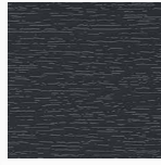
ANTHRAZITGRAU genarbt / glatt / matt