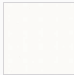
KIEFER RAL 9016 Verkehrsweiß